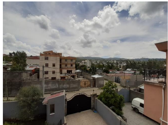
Addis Abeban rauhaa toukokuussa

Viimeisessä kirjeessäni kerroin teille toukokuuisesta Etiopian matkasta. Nyt kun katselen niitä kuvia, ajattelen sitä, kuinka nopeasti tilanteet muuttuvatkaan. Etiopian pohjoisosassa alkanut sotilaallinen kriisitilanne on viimeisten viikkojen aikana levinnyt etelämmäs myös Suomen Lähetysseuran hankealueille ja uhkana on sen leviäminen jopa pääkaupunki Addis Ababaan. Monet ihmiset ovat siirtyneet pois kodeistaan ja kotiseuduiltaan turvallisemmille alueille ja huoli ja levottomuus luonnollisesti on vallannut mielet. Mekin olemme seuranneet huolestuneina tilanteen kehittymistä ja pyydämmekin nyt viisautta ja rauhantahtoa kaikille osapuolille, jotta maa saisi tilanteen rauhoittumaan.