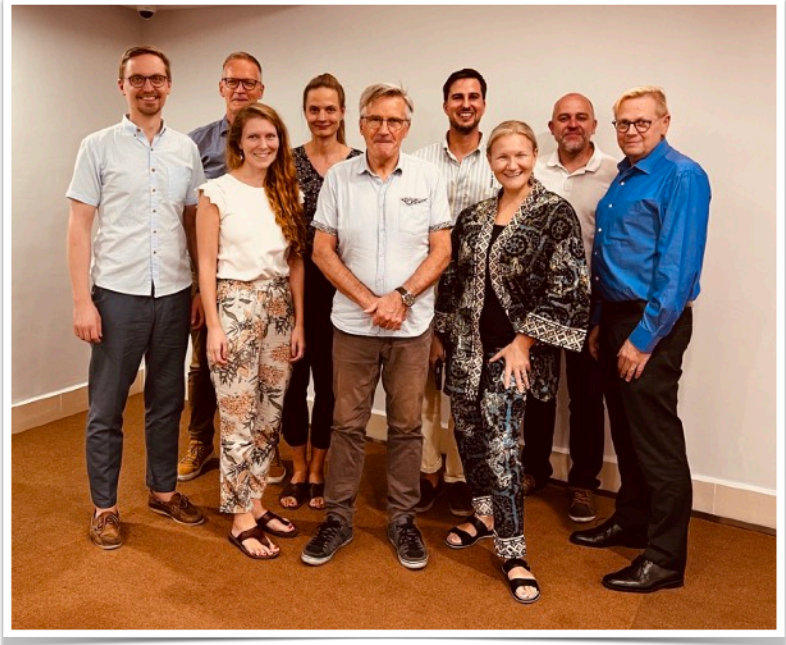
Kuvassa: Kuvassa poseeraa yhdessä Suomen lähetysseuran Aasian lähettien kanssa. Jumalan valtakunnan työssä on erityisen tärkeää, että emme näe toisiamme kilpailijoina, vaan yhteisen työn tekijöinä. Jumala toimii meistä huolimatta ja on luvannut itse viedä meistä riippumatta työnsä päätökseen ennen uuden aikakauden alkua. Tästä lupauksesta saamme iloita yhdessä ja kiitollisena auttaa ja palvella omia lahjojamme käyttäen.

huolimatta taustalla oleva tavoite on opettaa vastuullista rahankäyttöä, läpinäkyvää ja hyvää hallintoa sekä toiminnan tavoitteellista suunnittelua. Vaikeinta kirkkojen työssä on kuitenkin se, että työn tuloksia kuvaillaan pääosin laadullisesti: Ruoka-avun ja koulutuksen toimintaa voi kehittää ja mitata tavoitteellisesti, mutta uskoa ja rakkautta ei voi punnita. Hyvän paimenen vertauksella Jeesus haluaa opettaa kuulijoilleen, että yksikin ihminen on Jumalalle tärkeä. Diakonian rinnalle tarvitaan aina opetus- julistus- ja evankelointityötä tukevaa ja rohkaisevaa toimintaa. Sley'n työn painopiste Kaakkois-Aasiassa onkin tällä hetkellä teologisen koulutuksen kehittäminen, pappien sekä opettajien koulutus ja lapsityön tukeminen. Olen kokenut, että alueella on ainakin MMF:n esitelmien mukaan hyvä tasapaino diakonian sekä ilosanoman julistamiseen painottuvaa toimintaa. MMF:n merkitys on toisaalta myös verkostoituminen ja yhteinen ideoiden jakaminen. On innostavaa nähdä ja kuulla siitä, miten lähetystyötä tehdään lähimaissa ja saamme olla iloisia siitä, että vaikka työskentelemme eri järjestöissä ja kirkoissa, meillä kaikilla on yhteinen Herra ja yhteinen tavoite.