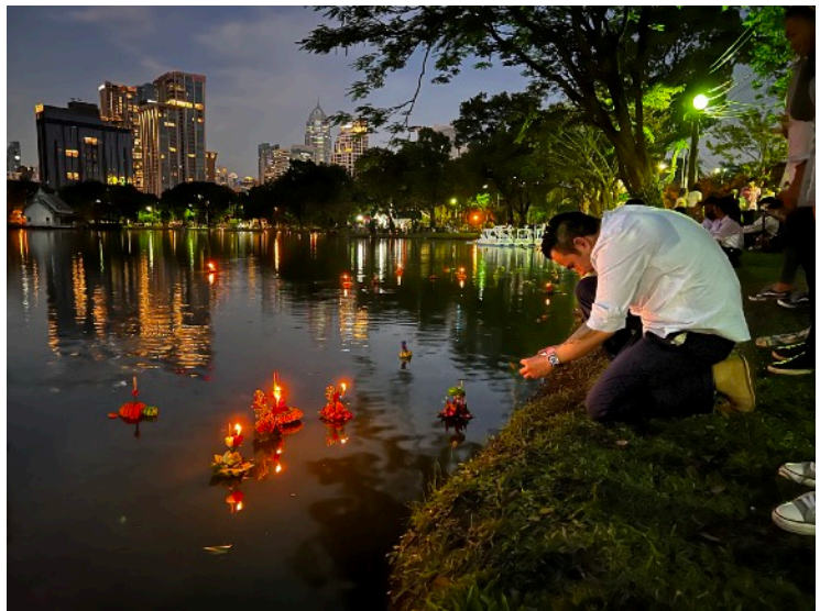
Kuvassa: Marraskuun alussa Thaimaassa vietetään Loi Krathong -juhla eli valon juhlaa. Banaaninkuoresta veistettyyn Krathong laivaan piilotetaan toisinaan jokin osa ihmisestä, jolloin ihminen symbolisesti päästää irti sisällään olevasta katkeruudesta, himosta ja pahoista ajatuksista ja antaa ne veden vietäväksi. Meille kristityille pyhä kaste on kertakaikkisen ja ikuisen armon merkinä sekä jatkuva muisto Jumalan armoliitosta kanssamme.

Pienille kirkkoille verkostoituminen on tärkeää, mutta vaikka yhteinen lähetysoorupahtuma yhdistää kirkkoja, usein edustajien englanninkielen taito on vuorovaikutuksen esteenä. Yhteinen kieli on englanti ja siksi kielitaitoinen kirkon edustaja osaa parhaiten toimia kirkkonsa eduksi. Foorumin virallinen anti on tällä hetkellä vähemmän hengellinen ja pikemminkin hankkeiden rahoitukseen liittyvää tukitoimintaa. Jokainen lähetysoorujärjestö ja paikallinen jäsenkirkko maksavat foorumin rahastoon vuosittain sovitun rahasumman, josta sitten hallintokulujen jälkeen paikalliset kirkot voivat hakea rahoitusta hankkeisiinsa ennalta lähetettyjen hakemusten perusteella. Joillekin länsimaisille lähetysoorujärjestöille tällainen malli on helppo, sillä MMF:n toimintaa tukemalla he tukevat lähetysoorujia alueella, mutta kaikki hankkeiden seurantaan liittyvä vastuu on paikallisilla kirkkoilla. Länsimaissa syntynsä saanut hankehallinnon kapulakieli sekä metodiikka on kuitenkin paikallisille yhteistyökumppaneille kuin myös toisinaan länsimaalaisille itselleenkin paikoin vaikeaa. Tästä